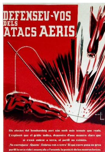
Cartell obra de Martí Bas, cedit pel CRAI (font: Arxiu Palau Robert).

Cosa que va continuar fent durant els tres anys de guerra com a comissari de Propaganda de la Generalitat de Catalunya, arribant a tenir una agenda important de contactes internacionals. A més, l'estima dels treballadors de la institució va ser molt notable, tal com demostra el text d'un acte d'homenatge que li van dedicar, reproduït en el llibre.