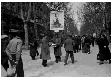
Home anunci.