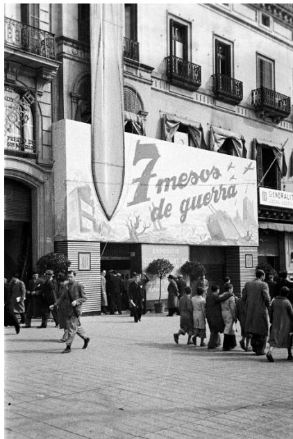
Exposició "Set mesos de guerra", organitzada pel comissariat.

Amb l'autorització de Companys i Azaña, l'estiu del 1938 Jaume Miravittles i Josep Maria Batista i Roca, van sondejar, secretament, els governs de París i Londres, per esbrinar quina posició tindrien davant una possible mediació per l'acabament de la guerra del 1936-1939. Miravittles es reuní amb el ministre d'Afers Estrangers francès, Georges Bonnet, amb tant de secretisme que es van trobar a casa del ministre que, aquell dia, va decidir donar festa al servei. Ell mateix va servir el dinar al comissari de Propaganda. Miravittles advocava inútilment per la mediació de França i Anglaterra, a fi de preservar la futura neutralitat d'Espanya ja molt dependent d'Alemanya i Itàlia, per una banda, i de l'URSS, d'una altra.