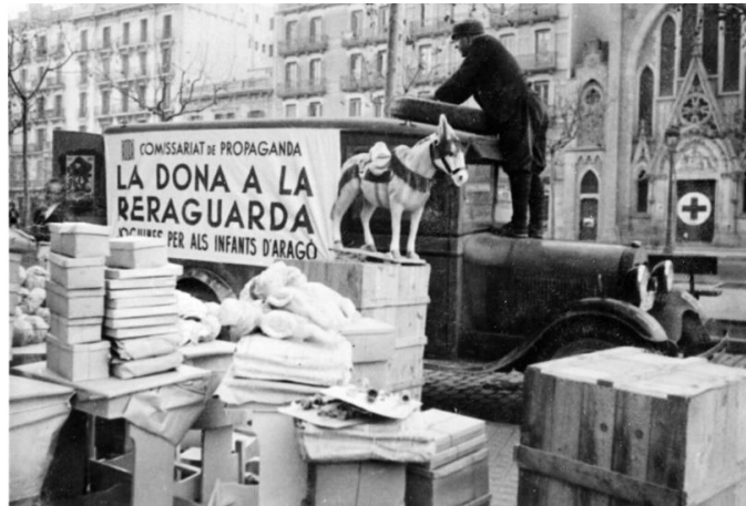
Joguines destinades al front de l'Aragó