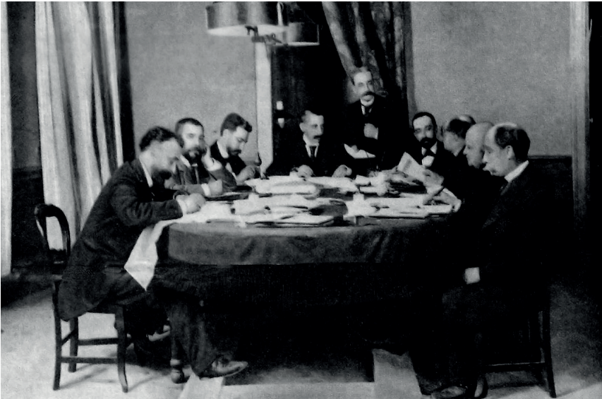
Joan Maragall —a la dreta de la persona que està dreta— a la taula de redacció del «Diari de Barcelona».

«Maragall va escriure per a diaris i revistes no solament articles periodístics, sinó també poesies, traduccions i altres textos.»