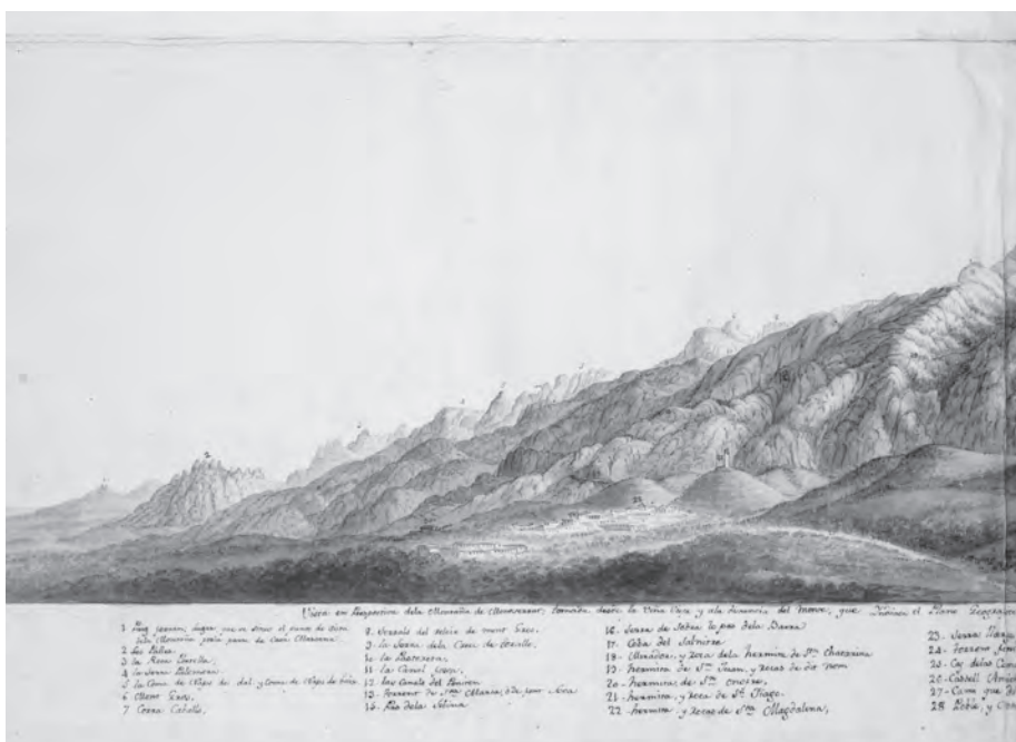
El castell i la vila de Collbató a finals del segle XVIII. (Detall del dibuix de Pere Pau Montaña i Francesc Renart, 1790, BM, ms. 1137).

Des de Martorell a Montserrat el camí circulava ja definitivament a ponent del Llobregat. Per evitar el congost de Monistrol, s'anava apartant progressivament del riu i passava pel mig de la plana que s'estén entre les muntanyes de l'Ordal i el massís de Montserrat, petita part de la depressió Prelitoral que hom anomena de vegades com la Conca de Montserrat. Travessava el poble d'Abrera, la vila d'Esparreguera i el petit nucli de Collbató fins a situar-se al peu de la muntanya de Montserrat.