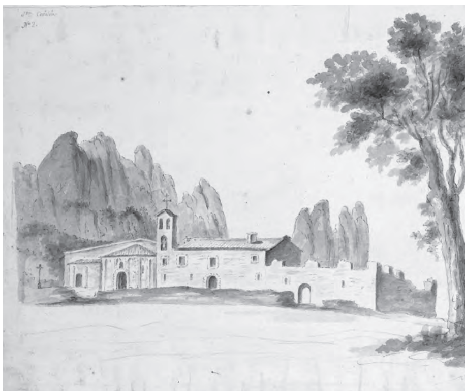
El monestir de Santa Cecília a finals del segle XVIII. (Dibuix de Pere Pau Montaña i Francesc Renart, 1790, BM, ms. 1137).

La funció religiosa d'aquest indret, que té un primer moment amb l'eremitisme, es veié reforçat amb la presència dels monestirs. El primer dels quals tenim notícia certa és el de Santa Cecília de Montserrat. Fou fundat l'any 942 al vessant septentrional de la muntanya pel clergue Cesari, que en fou el primer abat. Si bé les expectatives de l'abat Cesari respecte a l'arquebisbat de Tarragona es diluïren ben aviat, Santa Cecília subsistí com a cenobi independent fins l'any 1504, en què fou incorporat al de Santa Maria de Montserrat.