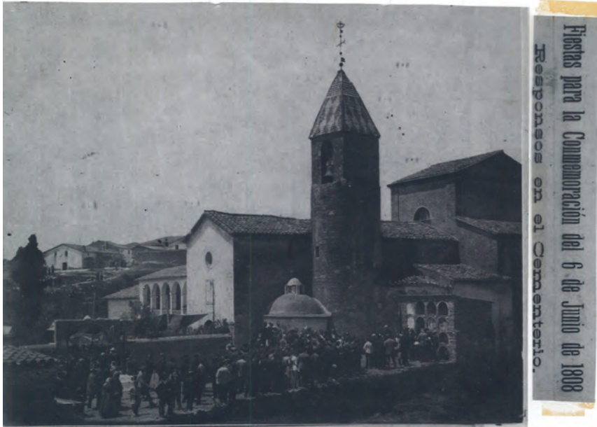
7. Absis i campanar tapats pels nínxols i el baptisteri. 1908.

no es podien observar en la seva totalitat. L'absis quedava tapat per una làpida en record dels bruquetans morts a causa de la Guerra del Francès i una construcció amb 12 nínxols. Passava el mateix amb el campanar que hi tenia adossat el baptisteri. 12