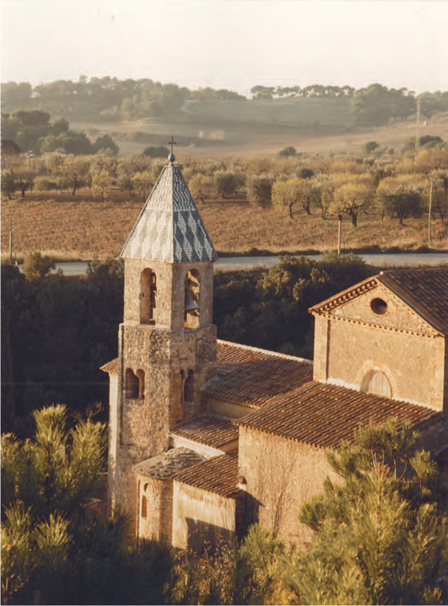
10. Vista des del serrat de Moixerigues. AFMB. Foto: Arxiu fotogràfic històric del Bruc.