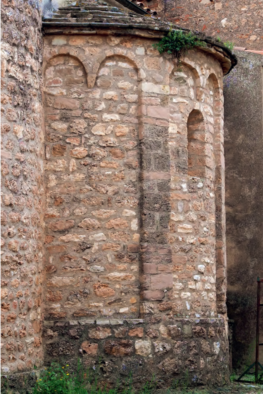
2. Absis romànic. Detall d'arquets cecs i lesenes.