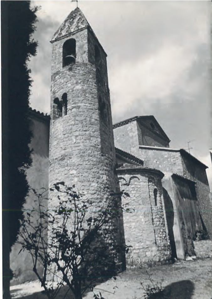
3. Absis i campanar romànic.

L'església té adossada la casa de la rectoria. Dins de l'actual entrada hi ha una gran portalada amb brancals de grans carreus de pedra i un arc de maó. Segurament era l'entrada principal d'una gran casa o masia que a l'època medieval ocupava part de l'espai de l'actual església. Aquesta edificació devia ser en part enderrocada quan es va edificar l'església actual i al mateix temps va haver de ser eixamplada o va créixer en l'orientació sud i oest. El conjunt de casa i església, el podem comparar amb l'església de Sant Miquel de Vilaclara, la qual tenia al seu entorn la gran masia de Can Guixà.