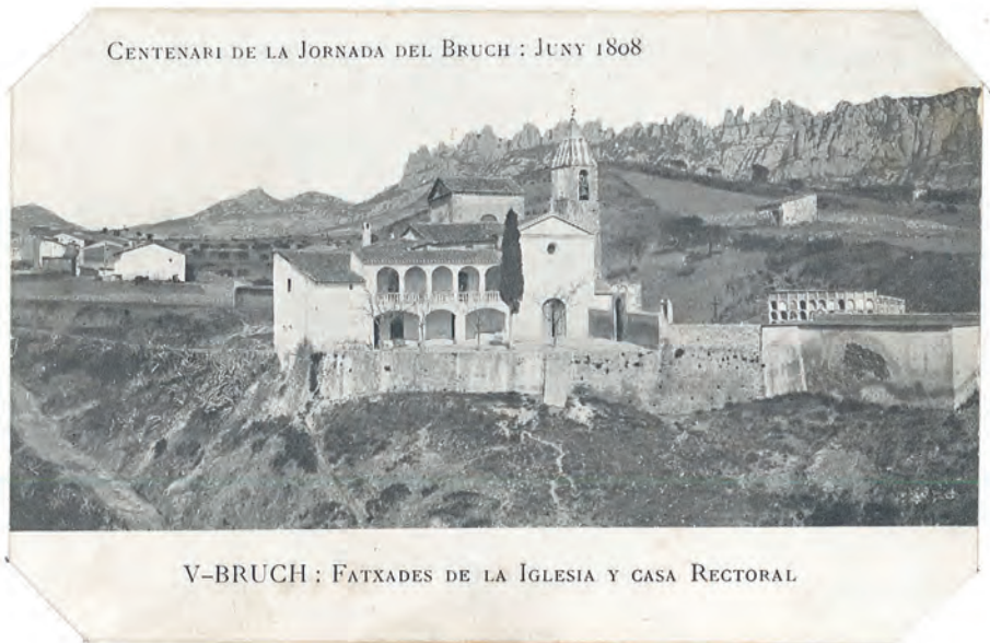
8. Vista d'església, rectoria i cementiri. 1908.