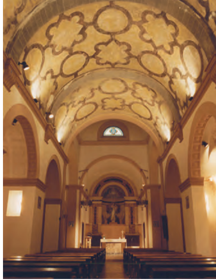
4. Volta de la nau de l'església amb els esgrafiats renaixentistes.

Possiblement va ser al segle XVIII, però no en tenim en aquest moment la constància documental, que la torre-campanar va ser modificada. Al damunt del primer pis s'hi va construir una petita torre de planta quadrada coronada per una estructura de forma piramidal decorada amb teules envernissades de color blau i blanc. En ser el primer pis circular i haver-hi de posar una torre de planta quadrangular, va quedar un dels costats del segon pis escairat.