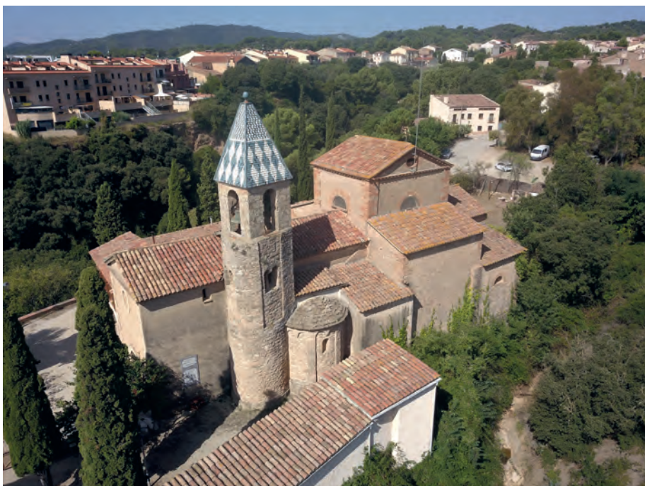
9. Vista aèria de l'església i l'entorn.