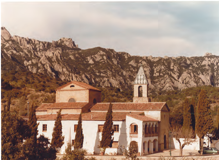
5. Vista de l'església i la casa de la rectoria.