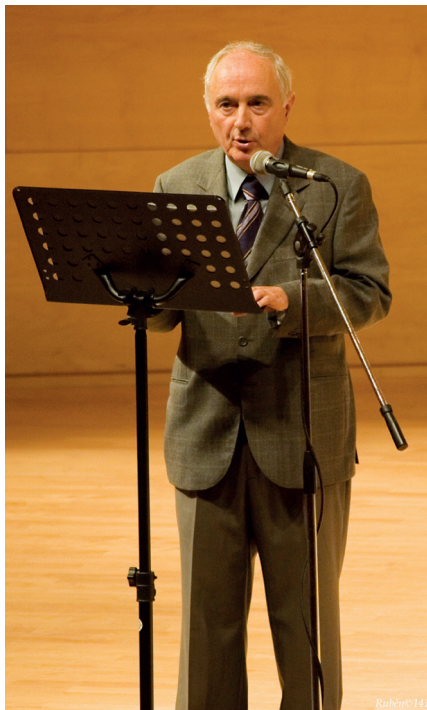
Eugeni Perea pronunciant un discurs a l'Auditori Josep Carreras de Vila-seca, el 4 de novembre del 2011.