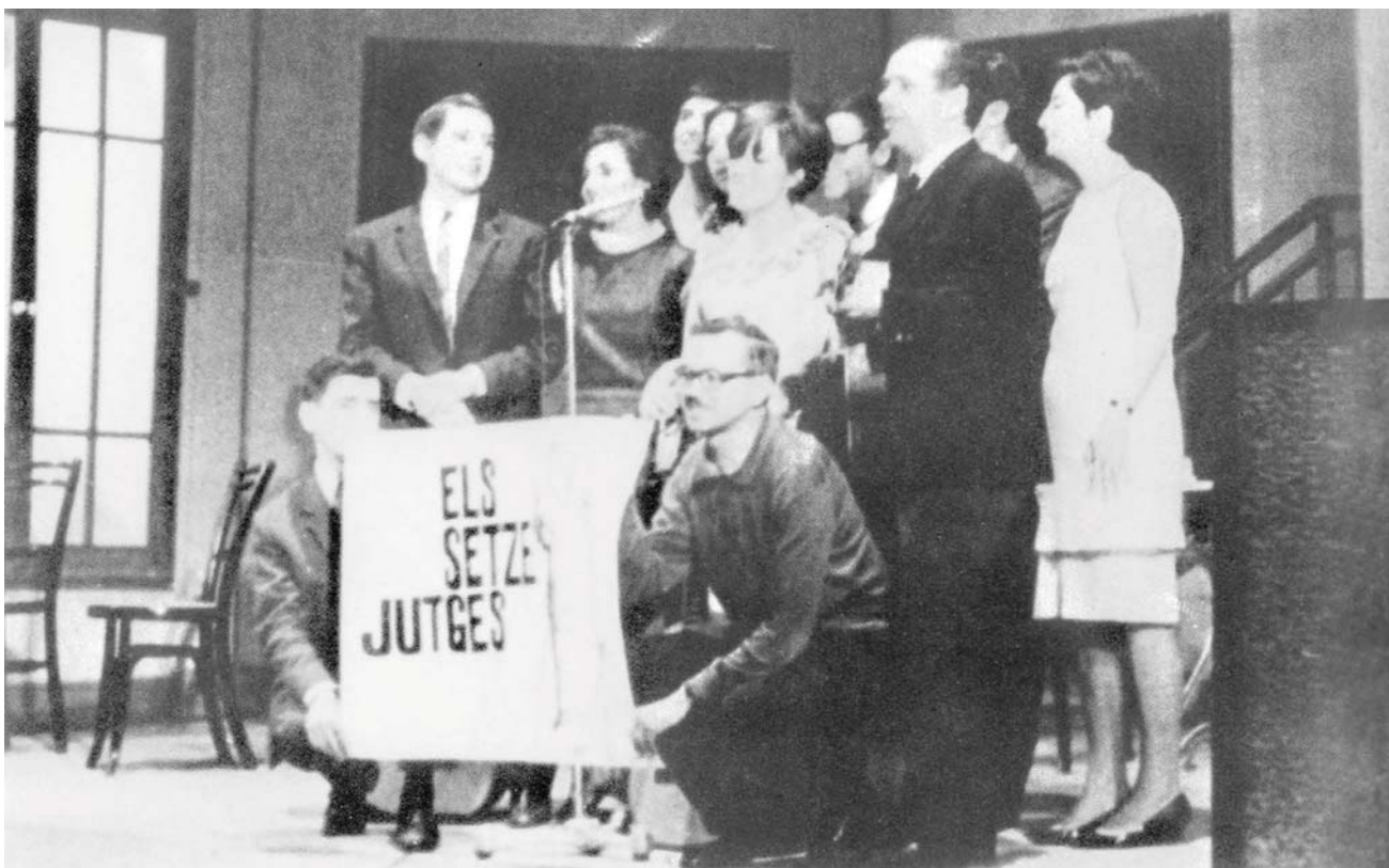
Als anys seixanta, Espinàs va ser un dels pioners de la Nova Cançó i va enregistrar mitja dotzena llarga de discos com a membre dels Setze Jutges. A la foto el veiem amb altres membres del col·lectiu de cantants ensenyant la pancarta amb el nom.