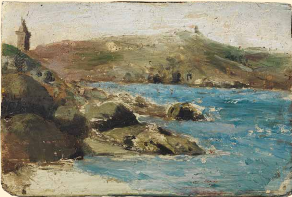
Pablo Picasso, La Torre d'Hercules . La Corunya, c. 1895, oli sobre fusta.