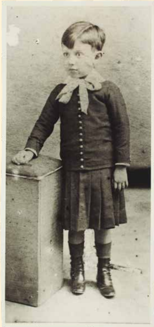
Pablo Picasso als tres anys. Màlaga, 1884.