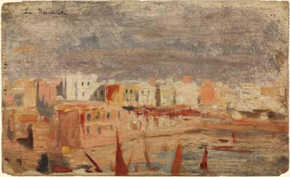
Pablo Picasso, La Barceloneta . Barcelona, gener de 1897, oli sobre fusta.