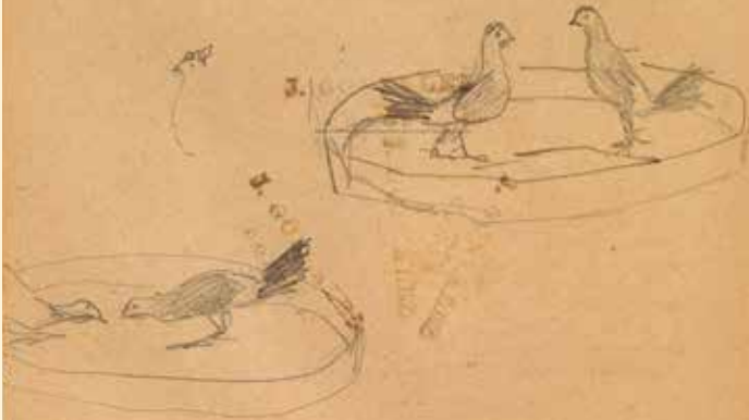
Pablo Picasso, Croquis diversos [Lluita de galls]. La Corunya, 1892, dibuix fet amb llapis, damunt d'un llibre escolar.

1 — premit altum corde dolorem , encierra en su pecho un grande dolor 2 — fusique per herbam . . . esparcidos por la pradera, se sacian de vino añejo y de la succulenta carne de los venados. 3 — amisos longo socios sermone requirunt . . . buscan á los amigos per- didos, llamándolos á grandes voces.