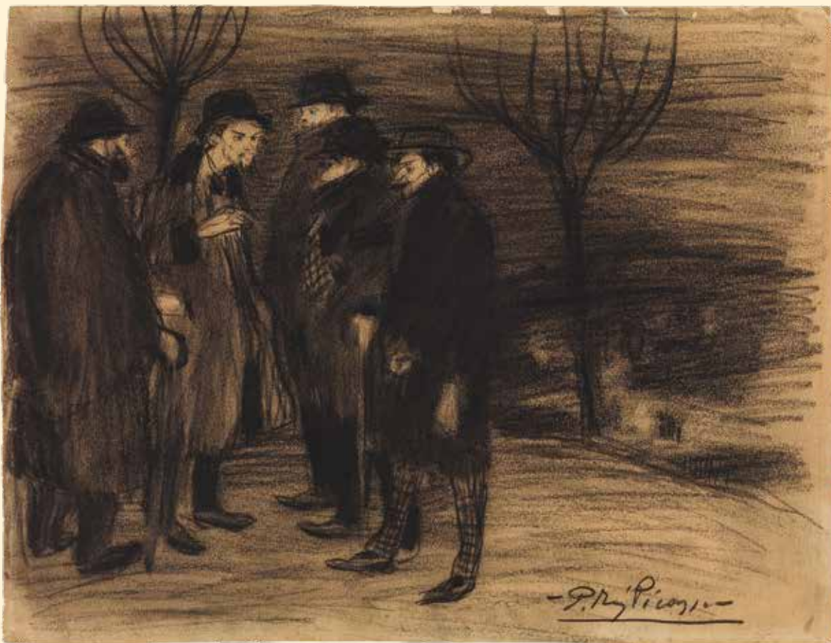
Pablo Picasso, Bohèmia madrilenya . Madrid, 1901, dibuix fet amb llapis damunt de paper.