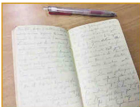
Algunes de les pàgines escrites per Ubach