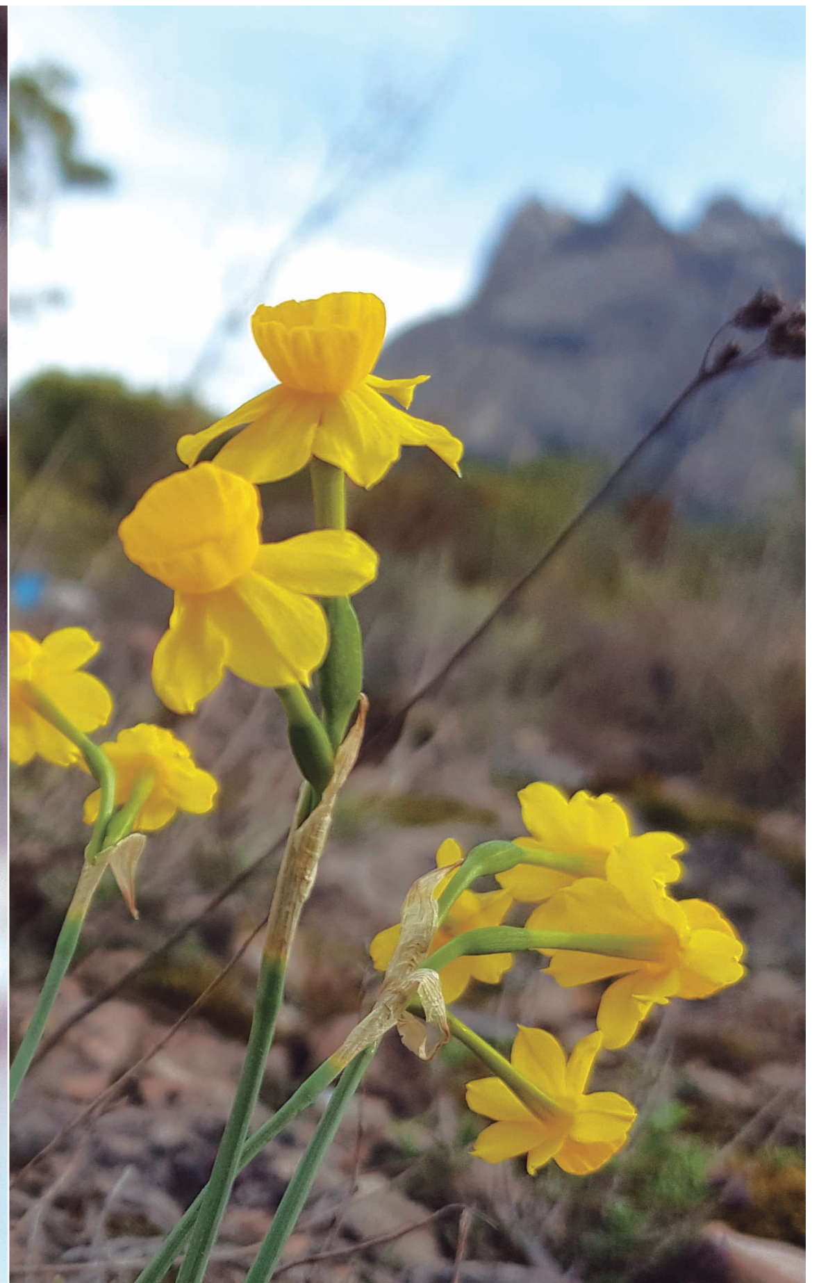
Almesquí ( Narcissus assoanus Dufour ). Floreix al febrer i, en segons quin lloc de la muntanya s'allarga fins al maig. És el narcís més senzill. Apareix abundantment a les codines eixutes i assolades dels relleus rocosos de la part alta de la muntanya.