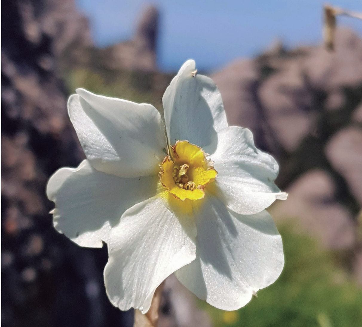
Nadala, allassa groga, caldereta, espasa de sant... ( Narcissus tazetta L.). Floreix de desembre a març. Planta estretament relacionada a la vida eremítica de Montserrat. Els ermitans la cultivaven als horts de les ermites per a usos ornamentals.