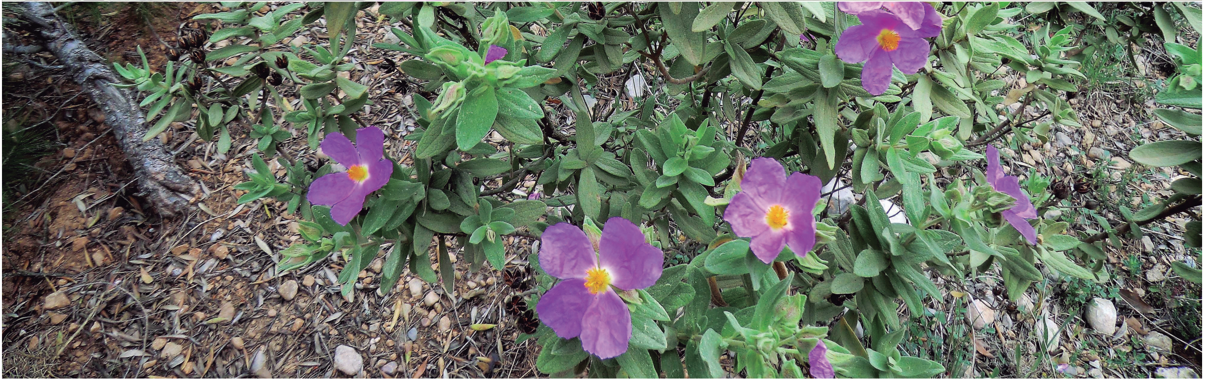
Estepa blanca ( Cistus albidus L.). El motiu del seu nom es deu a la pilositat de color clar i grisenc de tota la planta, no pas pel color de la flor (rosa purpuri). La seva floració s'allarga de maig a juny.