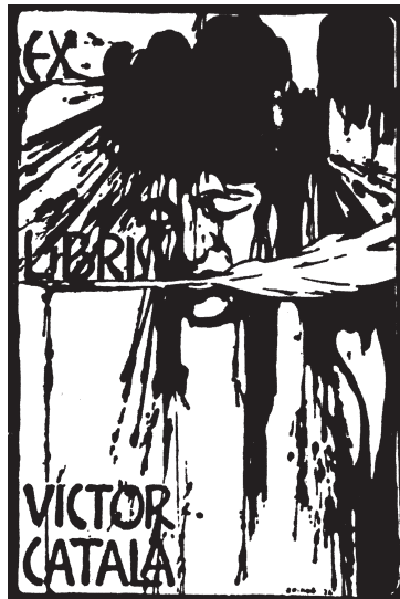
Exlibris de Víctor Català. (Arxiu Serra d'Or).