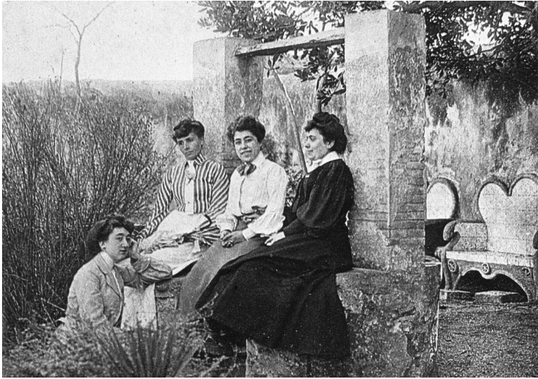
Al jardí de casa seva, asseguda entre dues amigues; la que està agenollada és la seva germana Amèlia.