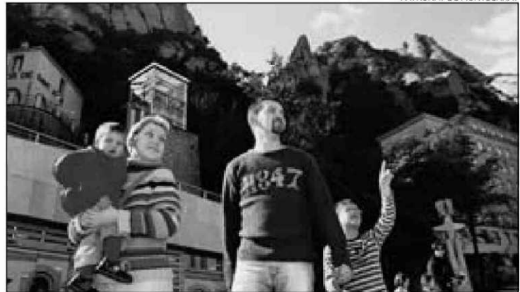
PATRONAT DE MONTSERRAT

El trajecte amb el cremallera fins a dalt al santuari és el millor aperitiu d'una activitat que, com en el conte, s'inicia al funicular de Sant Joan, que s'enfila fins a un dels