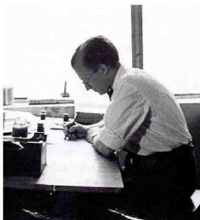
Pere Calders, a Mèxic. Les relacions literàries i culturals entre Catalunya i Llatinoamèrica són objecte de l'estudi Els catalans i Llatinoamèrica (s. XIX i XX). Viatges, exilis i teories .