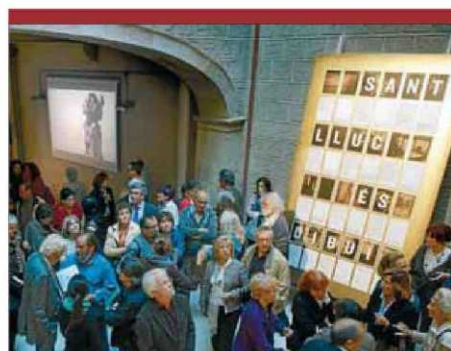
Manifest del dibuix a Sant Lluc el 2012

El pianista rus Evgeni Koroliov interpreta al Palau de la Música la seva versió de les Variacions Goldberg , de Johann Sebastian Bach.