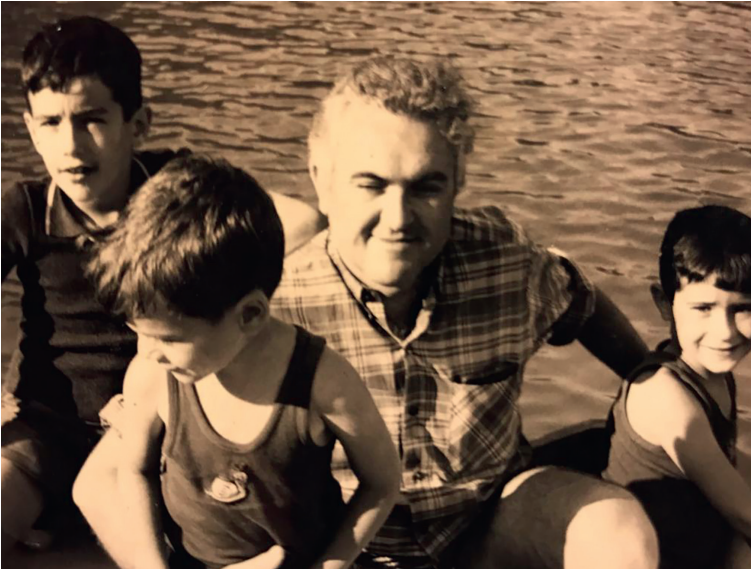
Als anys 70, acompanyat dels seus fills.