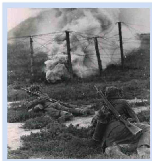
Soldats a la batalla de Krasni-Bor.