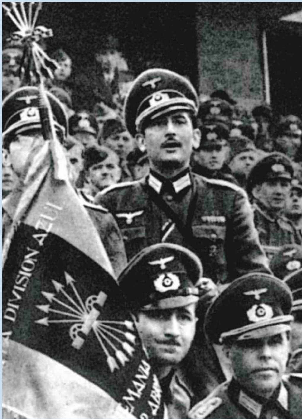
Soldats espanyols de la Divisió Azul amb l'uniforme de l'exèrcit alemany, durant un permís.