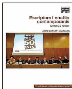
Portada del llibre de Massot.

Altres novetats són el diccionari etnolingüístic Mil veus de Bacus , el Diari de tosa de Ki o Tsurayuki i el Dietari d'un viatge per les regions de l'Iraq , que realitzà Bonaventura Ubach entre 1922 i 1923. • F.M.