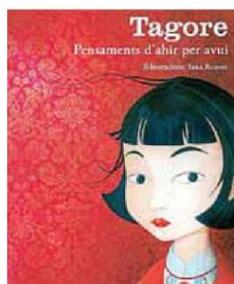
Els versos de Tagore.