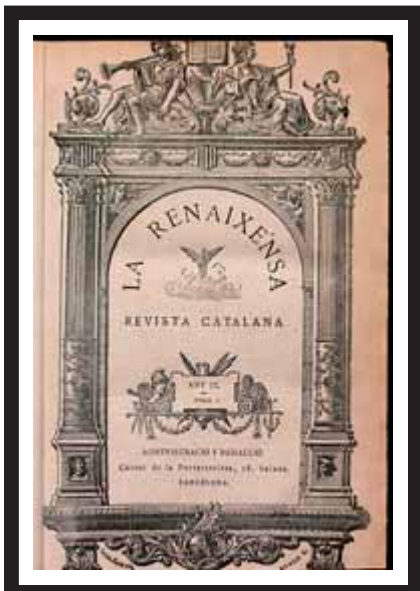
Algunes de les portades de 'La Renaixensa' durant els vint-i-cinc anys que va existir gairebé ininterrompudament