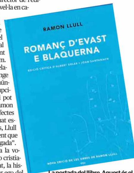
La portada del llibre. Aquest 3s el vuitè volum que edita el Patronat Ramon Llull.