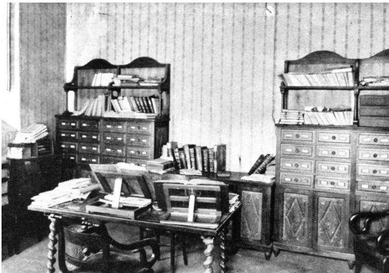
Gabinet de treball de Fabra. Saleta de la primera reunió de l'Institut.