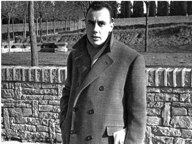
Desembre 1953. Quan el poeta va guanyar el Premi Óssa Menor.