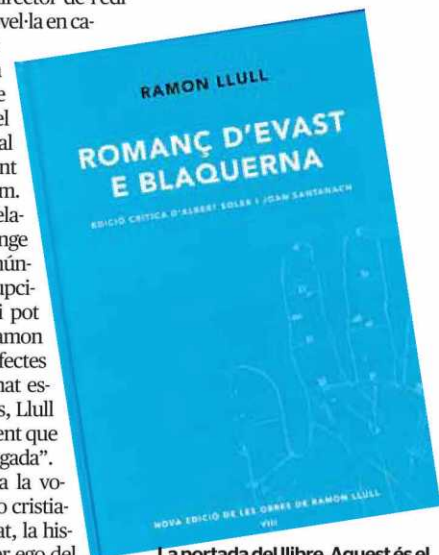
La portada del llibre. Aquest 3s el vuitè volum que edita el Patronat Ramon Llull.